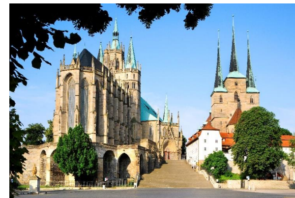
Dom & Severi-Kirche Erfurt

Wir bedanken uns herzlich für die Unterstützung durch Firmen, Vereine und Institutionen, die sich aktiv am Diabetesmarkt beteiligen.